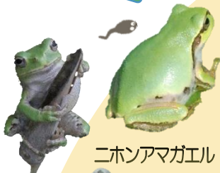
ニホンアマガエル

日本には 46 種類のカエルが住む。高い山や海を越えられない蛙は日本で独自の進化をとげているので、80%は固有種。世界には 5400 種類のカエルがいる。