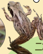
ニホンアカガエル

絶滅危惧種。体長 3.5~7.5cm。森に住む生体は 1~3 月に水辺で雌雄が出合い産卵する。周囲の水が凍って卵が死滅することもある。