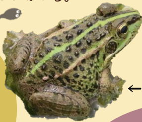
トウキョウダルマガエル

体長 2~5cm 位。目のところに黒い線がある。背景の色に合わせて体色を変える。皮膚から出す粘液には刺激性の化学物質が含まれている。イネ科の植物の害虫を食べてくれる。